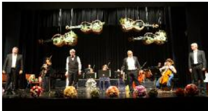
Die vier Sänger des Reblaus Quartetts haben ihre langen musikalischen Erfahrungen bei bekannten Chören gesammelt. Aber sie sind nicht nur der Musik sondern auch wegen ihrer Liebe zum guten Rebensaft besonders der Gattung des Weinliedes verfallen.